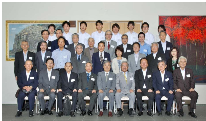
(「栄誉学友称号並びに感謝状贈呈式」及び「感謝の集い」にご出席の皆様と本学役職者・学生)