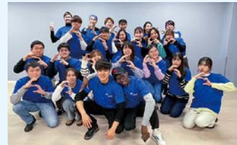
国際交流活動を盛り上げる学生スタッフたち